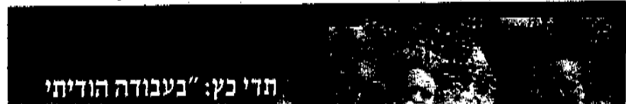
תדי כץ: "בעבודה הודיתי

על הטבח בסנטוזה. כץ ביקש להוכיח שבמאי 1948 לוחמי חטיבת אלכסנדרוני ביצעו מעשי זוועה בתושבי הכפר וגם הביא עדויות. הוא קיבל על עבודתו את הציון הגבוה 97. כשוותיקי החטיבה הגישו תביעת דיבה ונמצא שחלק מהעדויות שמופיעות בעבודה אינן מופיעות בקלטות שתומללו על ידי כץ, זה נגמר בפשרה בבית המשפט. כץ הסכים להתנצל בפני הלוחמים שלא היה טבת. מאוחר יותר הוא רצה לחזור מהתנצלותו, אבל בית המשפט כבר לא אישר. וערה שמינתה האוניברסיטה כדי לברוק את