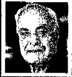
אברהם אמי': ראית פעם ערבי שלא יגזים בטיבונים שלו?