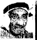
אבנ חאלב: הזבילו אותם ליד שיחי הסברים ושם ידו בהם