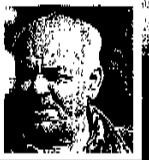
אבנ שילב: סידרו את הבחורים לאורך הקירוח