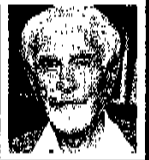
בני צידן: זו הייתה מלהמה, ובמלחמה נהרגים אנשים