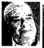
אבנ גייל: יהודי הסתובב ברחובות ידה באנשים