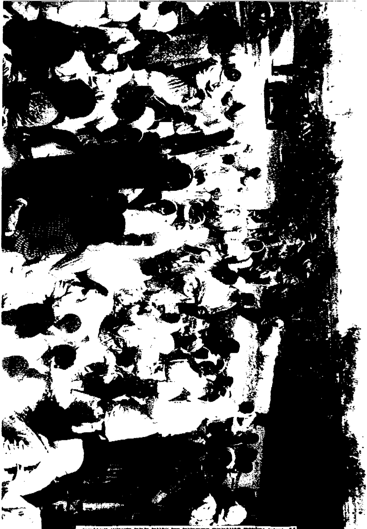
11. נשים וילדים בטנטורה בהמתנה בת שעות תחת השמש הכופות...